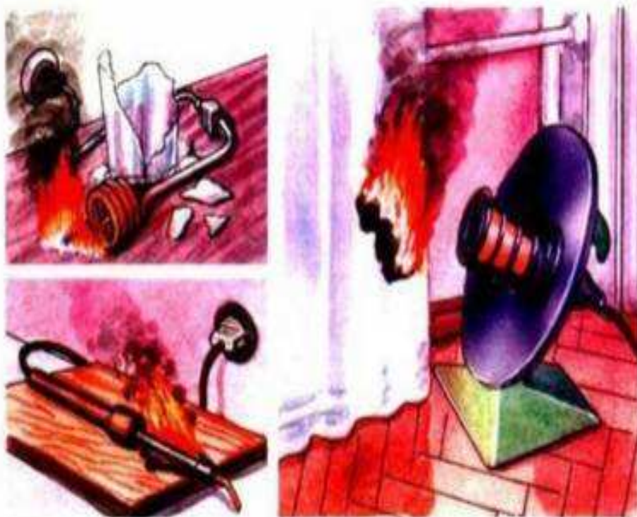
Оставление без присмотра электрических нагревателей kuhta.dan.su