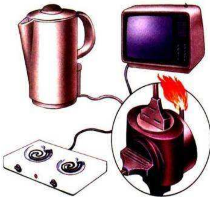
Перегрузка электропроводов kuhta.dan.su